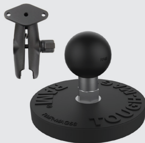
RAM MOUNTS MAGNETISCHE BASISPLATTE (RUND) - B-KUGEL (1 ZOLL) RAM-B-MAG66U RAM-B-103-238U