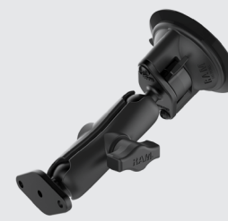
RAM MOUNTS SAUGFUSS-SET MIT DIAMOND-ANBINDUNG RAM-B-166U