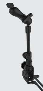
RAM MOUNTS UNIVERSAL FAHRZEUGBEFESTIGUNG MIT DIAMOND-ANBINDUNG (TRAPEZ) RAM-316-HD-238U