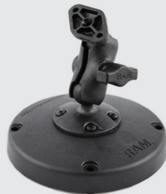
RAM MOUNTS UNIVERSAL DESKTOP- STANDHALTERUNG RAP-B-291-A-238U