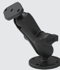
RAM MOUNTS SET - B-KUGEL (1 ZOLL) RAM-B-138U