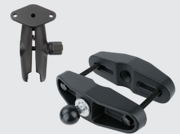
RAM MOUNTS SCHRAUB- KLEMME - B-KUGEL (1 ZOLL), KLEMMBEREICH 44,5-101,6 MM RAM-B-247U RAM-B-103-238U