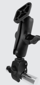
RAM MOUNTS TOUGH-CLAW SET - B-KUGEL (1 ZOLL) RAP-B-400-238U