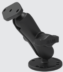
RAM MOUNTS SET - B-KUGEL (1 ZOLL) RAM-B-138U